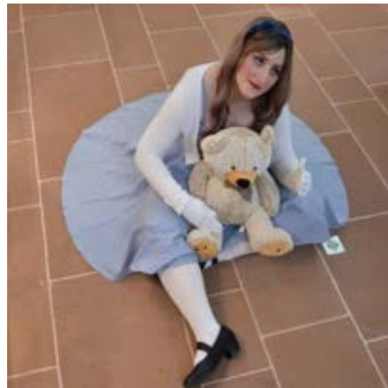
Poupée Lili à la Nef des Jouets (Visites théâtralisées)