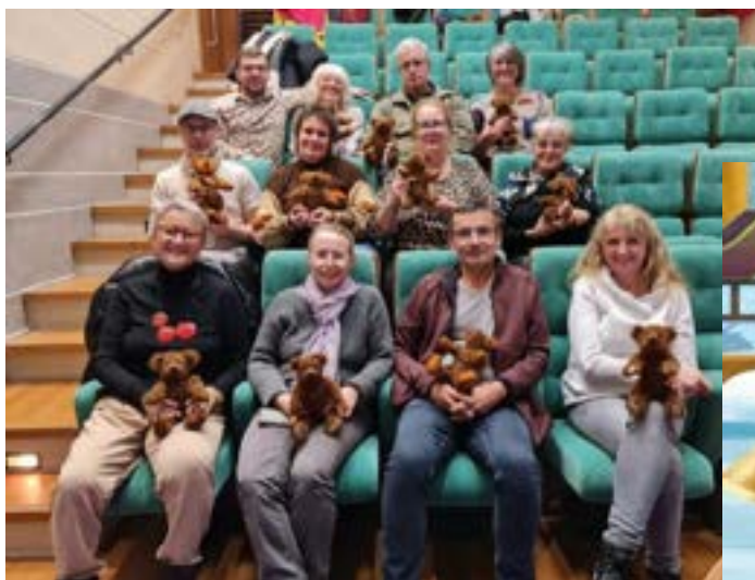
Stage de fabrication d'ours en peluche 18 & 19 novembre