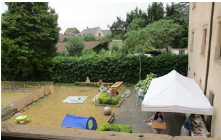
Fête du RPE (Relais Petite Enfance) / Bébés au musée – installations dans le jardin de la Commanderie -28 juin