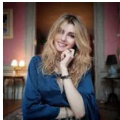
Concert pop-rock - 22 juin avec la chanteuse EDEN.