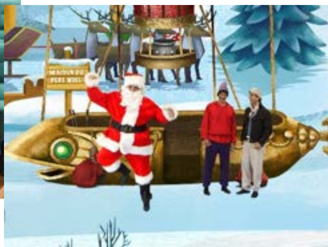
Spectacle « Un tour du monde pour le Père-Noël » - 3 décembre – Cie « La Cicadelle »