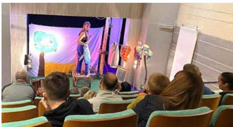
Spectacle « Viens à la chasse au trésor » / Mois des 5 Sens – 15 octobre Cie « Les Fées du Logis »