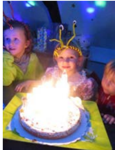
Anniversaires sur le thème de l'espace – mars à décembre