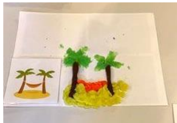
Spectacle « Des chansons dans nos cartons » - 6 & 7 octobre / Pôle Culturel Cie « L'Atelier du Sous-Sol » et Cie « Le Vent en Poupe »