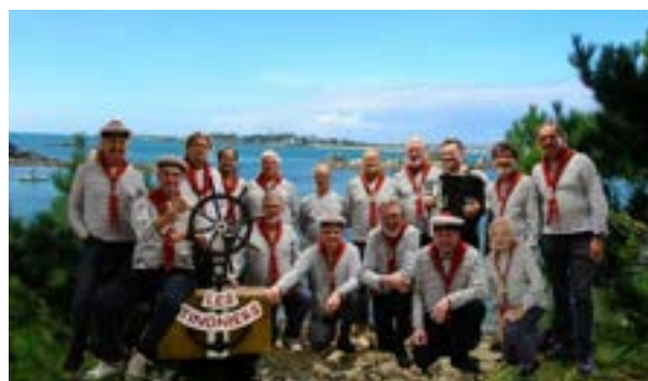
Les TINONIERS - 15 juin - chœur d'hommes de Thann